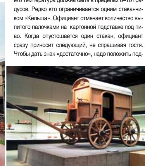
Римско-германский музей. Римская повозка