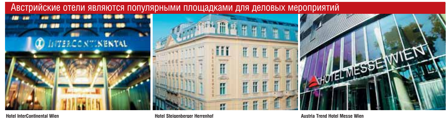
Hotel InterContinental Wien

В целом можно с уверенностью сказать, что все девять федеральных земель Австрии обладают отличным потенциалом для MICE-туризма и стремятся развивать эту инфраструктуру в дальнейшем. Ближайшим смотром достижений австрийской MICE-индустрии станет access – ведущая специализированная выставка по теме «Конгрессы, заседания, деловые мероприятия и инсентив», которая пройдет 24 и 25 сентября 2012 г. в венском Хофбурге ( www.access-austria.at ). ■