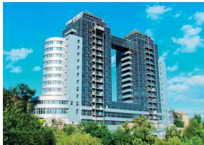
Отель Four Points by Sheraton, Запорожье

Аэропорт Львова расширяет географию полетов. В текущем году отсюда начнется прямое авиасообщение с Лондоном, Барселоной и Парижем. Но-