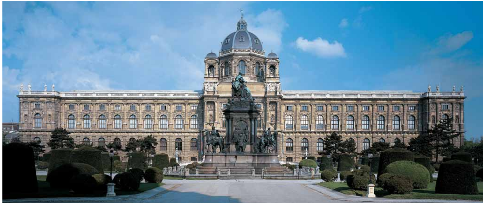
Музей истории искусств, Вена