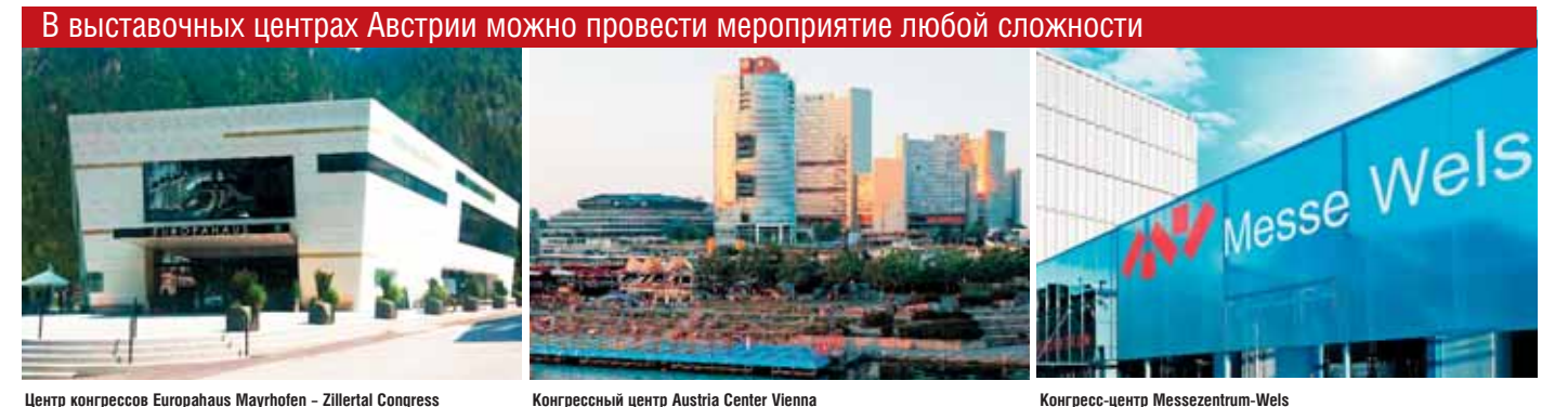
Центр конгрессов Europahaus Mayrhofen – Zillertal Congress