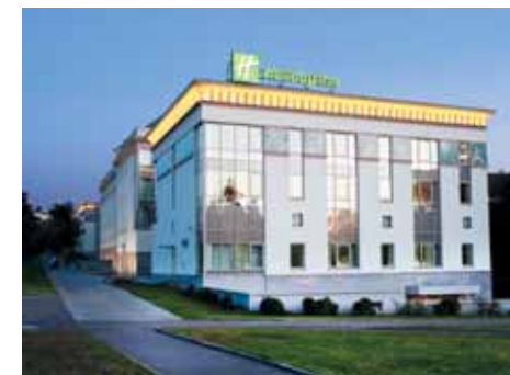
Отель «Holiday Inn Москва Симоновский» – самый молодой из всех столичных отелей Holiday Inn