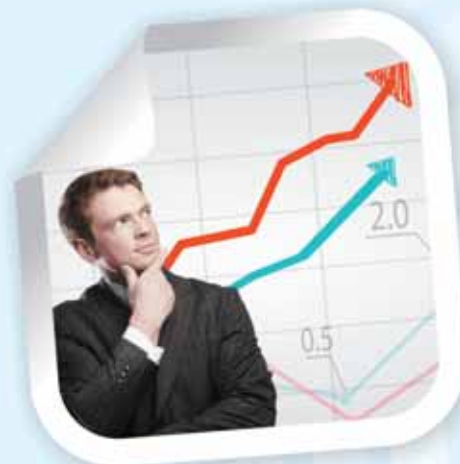
DEMLINK | MONEY