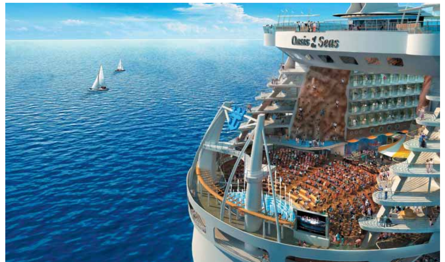
Современные круизные суда могут быть прекрасными MICE-площадками. На них есть все для проведения мероприятий практически любого вида – от инсентивов до конференций

В октябре 2010 г. для итальянского представительства всемирно известной компании Unilever была организована конференция на борту круизного лайнера, где компания представила дилерам свою новую продукцию. Среди 500 участников были представители из Италии и других стран Европы. В программу мероприятия входили три полных конференц-дня и интересные развлекательные мероприятия с интерактивными экскурсиями в Барселоне, Тунисе и Мальте. ■