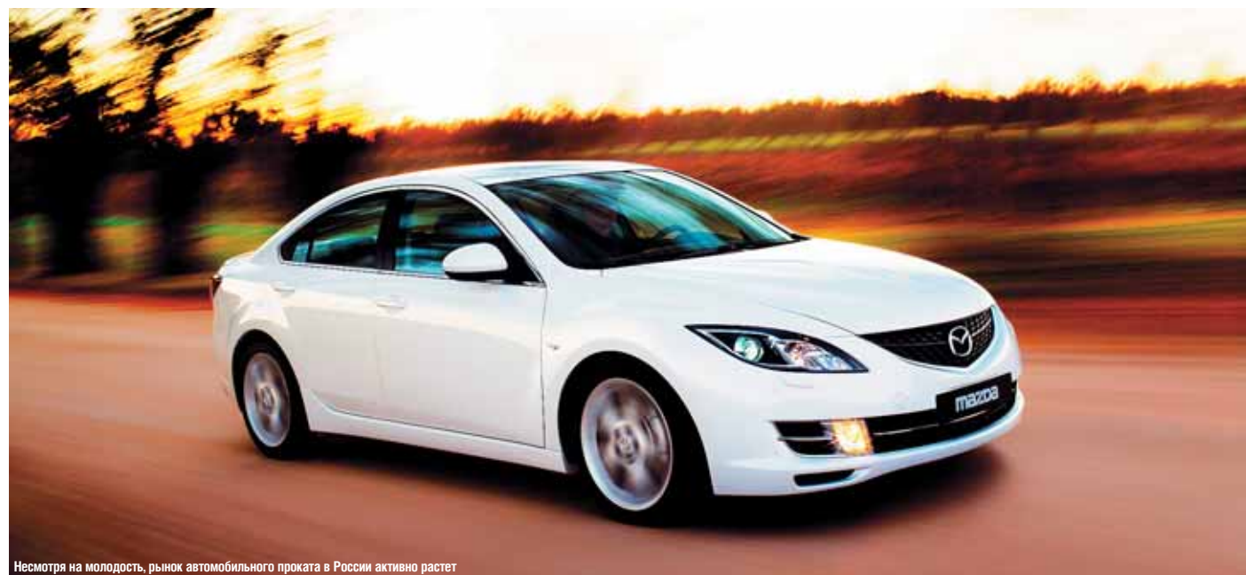
Несмотря на молодость, рынок автомобильного проката в России активно растет