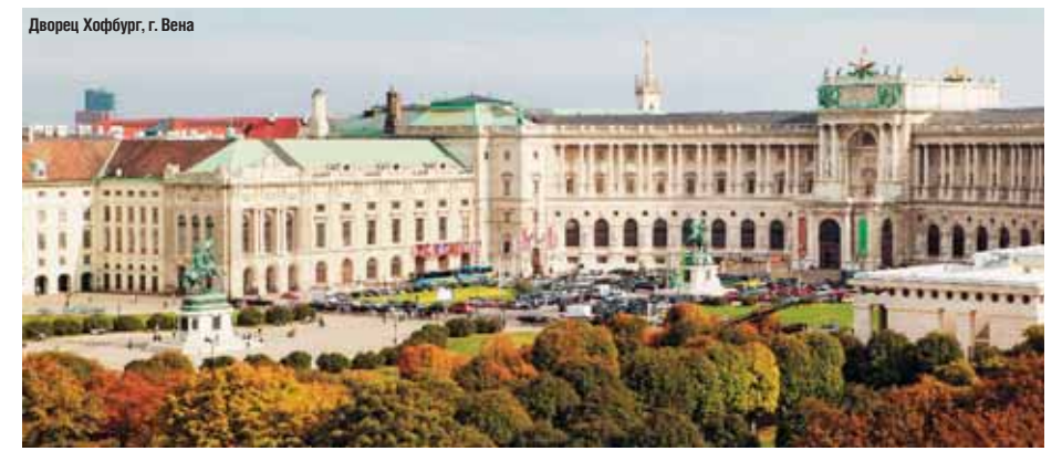
Дворец Хофбург, г. Вена

Зальцбург очень удобно расположен и отлично соединен автомобильным и железнодорожным сообщением с регионами федеральной земли Зальцбургер Ланд, что позволяет дополнить деловую программу увлекательными экскурсиями и программами тимбилдинга. Например, всего за полтора часа на поезде можно оказаться на курорте Целль-ам-Зее или в долине Гастайн. Эти хорошо известные зимние горнолыжные курорты на самом деле могут предложить круглогодичную активную и оздоровительную программу: водные виды спорта, серфинг, скалолазание, маунтинбайкинг, велнес-процедуры и многое другое. В том же Целль-ам-Зее также