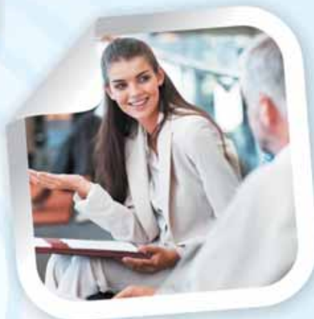
DEMLINK | MICE