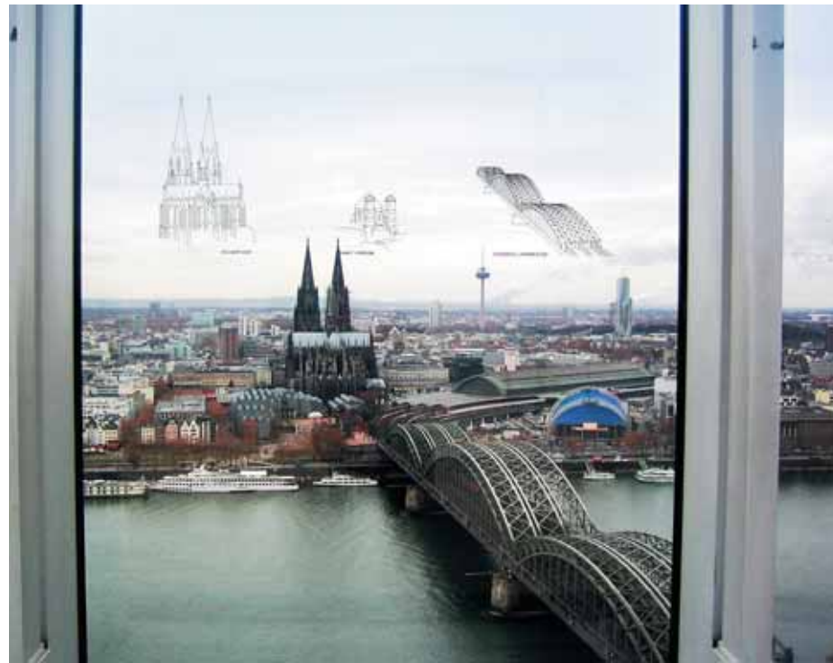
Башня Triangle. Хорошо видны контуры достопримечательностей на стеклянной стене