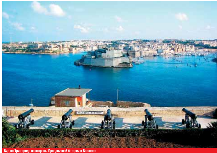
Вид на Три города со стороны Праздничной батареи в Валлетте