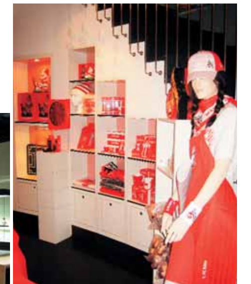
Туристический информационный центр