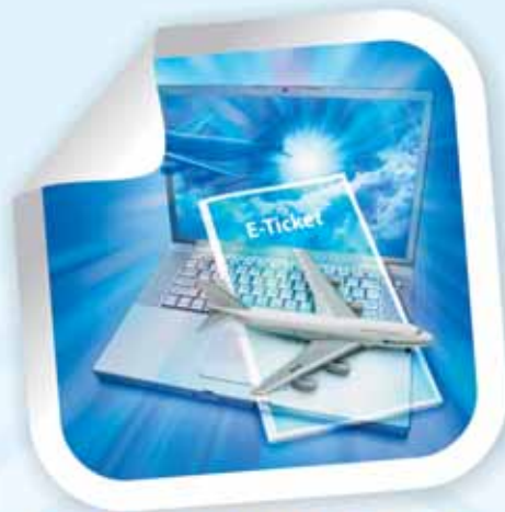
DEMLINK | ONLINE