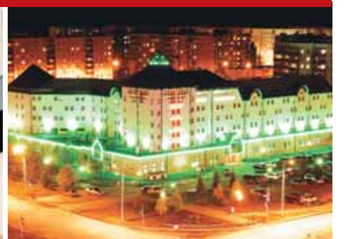
Гостиница «Славянская», г. Тобольск