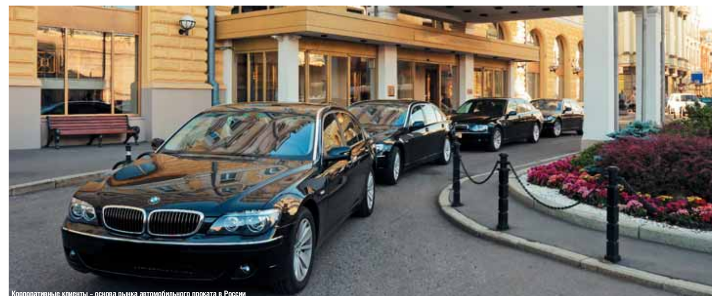
Корпоративные клиенты – основа рынка автомобильного проката в России

ущерб, причиненный компании, включая полную стоимость восстановительного ремонта и запасных частей, а также удовлетворение претензий третьих сторон. К нарушениям договора аренды в том числе относится управление автомобилем в состоянии алкогольного опьянения или отказ от прохождения освидетельствования. ■