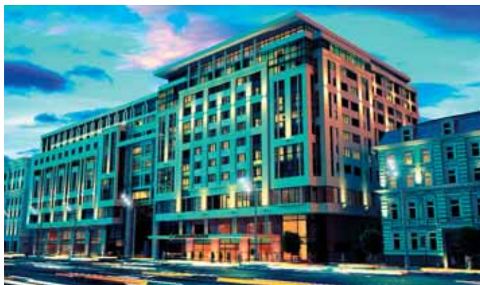
Отель InterContinental Moscow Tverskaya открылся в декабре прошлого года