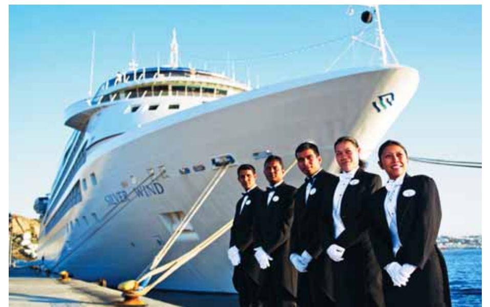
Круиз – хороший способ нестандартного проведения мероприятий

В сентябре 2010 г. была организована конвенция для крупной итальянской компании Richard Ginori