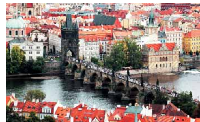
Прага не случайно выбрана местом проведения конгресса. В городе множество разнообразных и удобных MICE-площадок

грустно пошутил один из выступавших: «Для многих неевропейцев наши страны мало чем отличаются друг от друга».