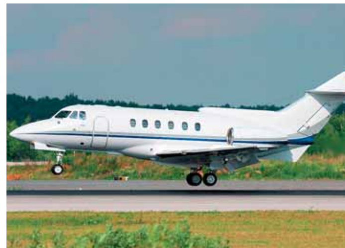
Самолет Hawker HS 125-700 отличается дальностью полета и высокой экономичностью