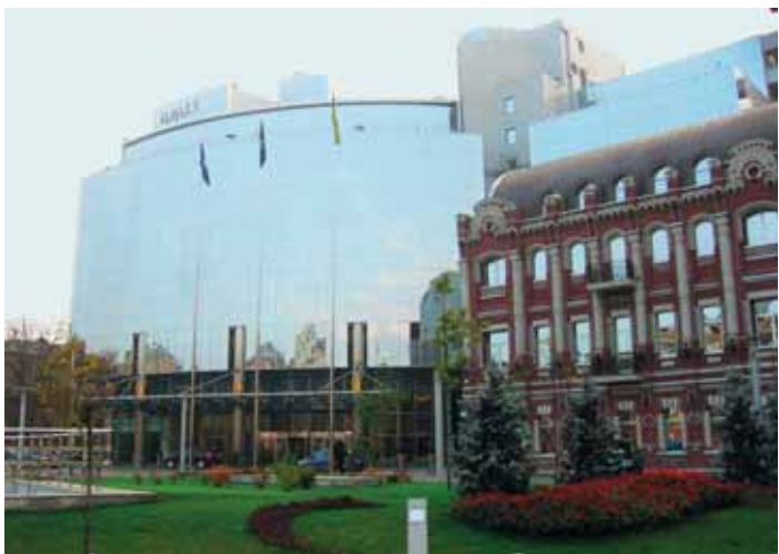
Отель Hyatt Regency, Киев, Киев

Таким образом, можно говорить о немалом кредите доверия, который сейчас есть у туристической отрасли Украины в глазах мирового сообщества, так что удачное проведение ЕВРО-2012 может стать первым шагом на пути к превращению главных деловых центров Украины в направления индустрии встреч европейского уровня. ■