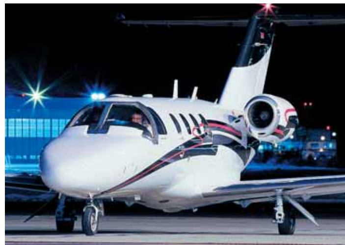
Самолет Cessna CJ – один из самых популярных бизнес-джетов в России