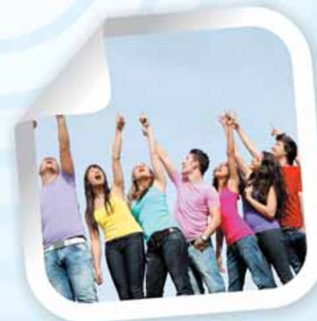
DEMLINK | PEOPLE

Генеральный директор: Иван Капашников Шеф-редактор: Александра Загер Шеф-редактор тематических выпусков: Александр Попов Редактор: Элеонора Арефьева Авторы: Андрей Барановский, Полина Бойцова, Ирина Клименко, Светлана Коновалова, Анна Юрьева, Александра Хмельева Корректор: Ольга Помелова Художники: Светлана Обуховская, Владислав Суровегин Фото на обложке: Михаил Тимонин Фотографии: Юлия Калашникова, Михаил Тимонин Отдел рекламы: Ольга Мальцева, Наталия Далевиц, Евгения Шуманская Отдел информации и распространения: Лариса Тарасюк Отдел workshop: Людмила Сивова, Виктория Кудряшова, Алевтина Корева