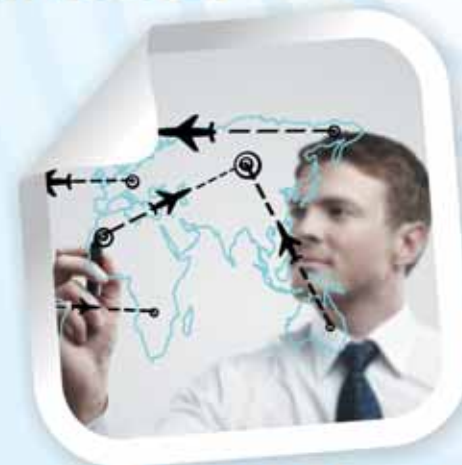
DEMLINK | CLUB