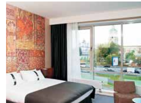
Стандартный номер отеля