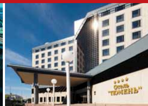
Отель «Тюмень», г. Тюмень